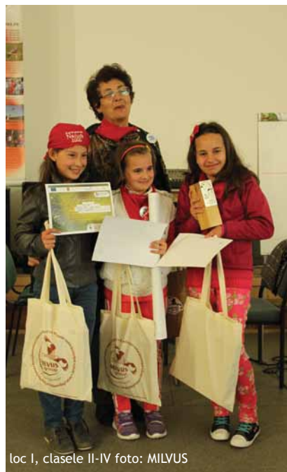
loc I, clasele II-IV