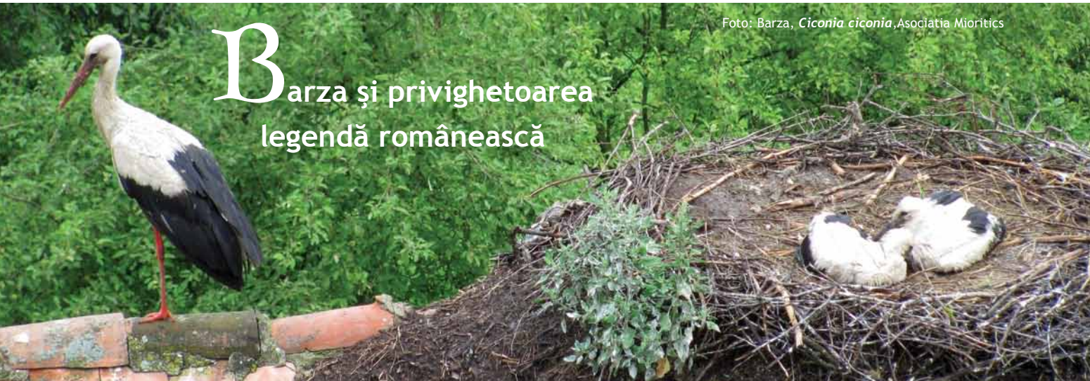
Foto: Barza, Ciconia ciconia