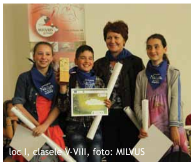
loc I, clasele V-VIII, foto: MILVUS